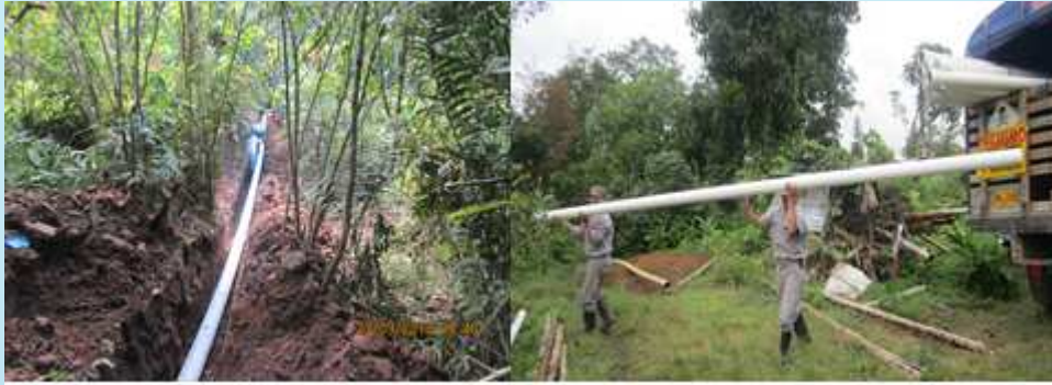
Reposición de las redes de conducción y distribución de acueducto a PVC