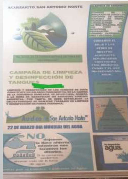
CAMPAÑA DESINFECCIÓN TANQUES AEREOS