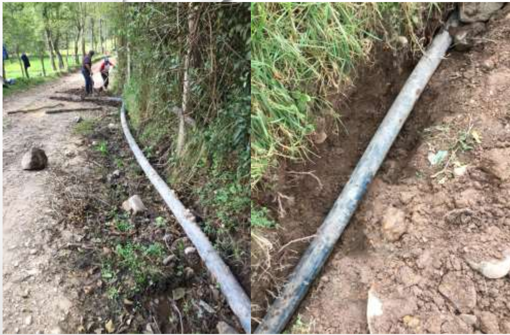
RED BOCATOMA A PLANTA