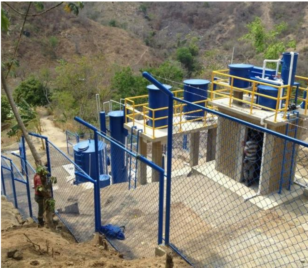
Resguardo Indígena Chimila (corregimiento Gaira), Santa Marta – Magdalena